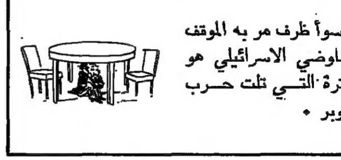
أسوأ ظرف مر به الموقف التفاوضي الاسرائيلي هو الفترة التي تلت حرب أكتوبر